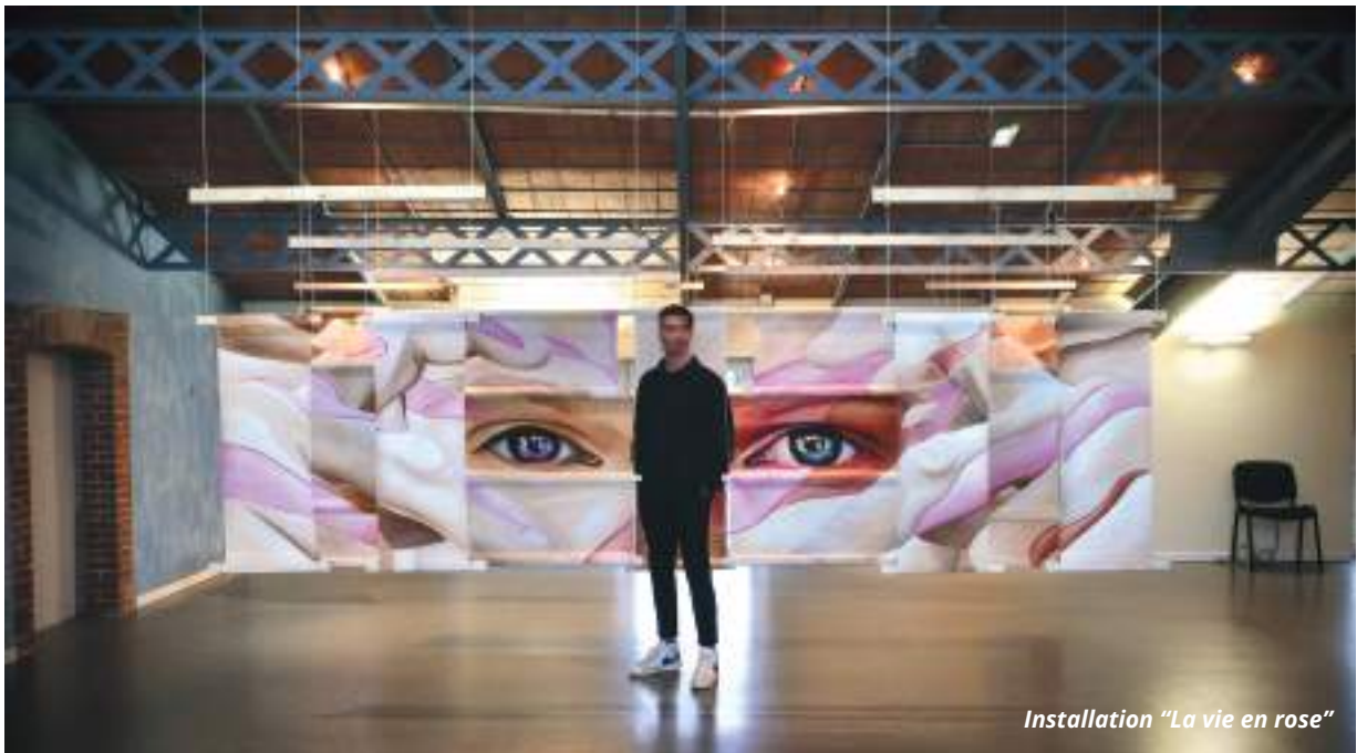
Installation "La vie en rose"

Habitué aux supports variés allant de la toile à la façade, Louis Pouilhe conçoit et réalise aussi des installations en 3 dimensions où peinture et effets d'optiques viennent s'associer pour mieux tromper l'oeil.