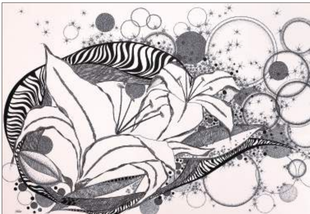
” «Lys», exploration intérieure en noir et blanc, représentation de l'acceptation et d'une sérénité retrouvée. “