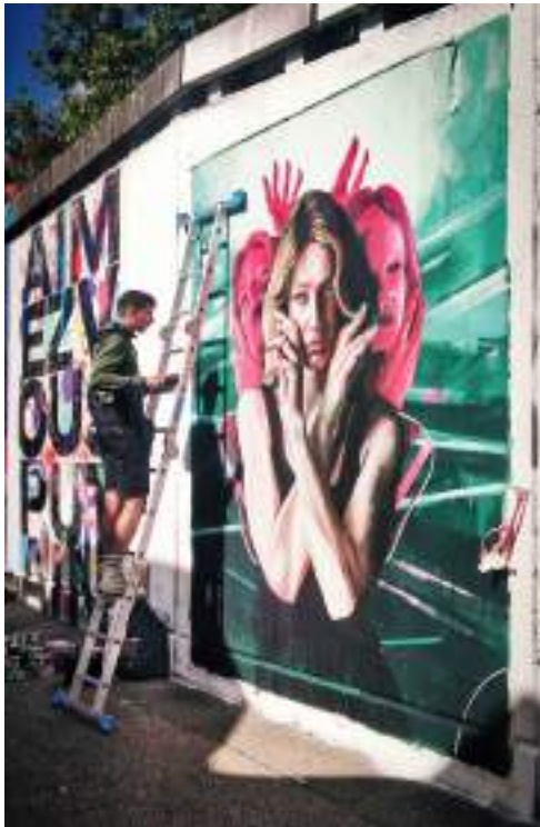
Fresque à Villefontaine

Le style de Louis Pouilhe peut être décrit comme un hyperréalisme contemporain, mêlant techniques traditionnelles et influences modernes pour créer des œuvres profondément expressives et immersives.